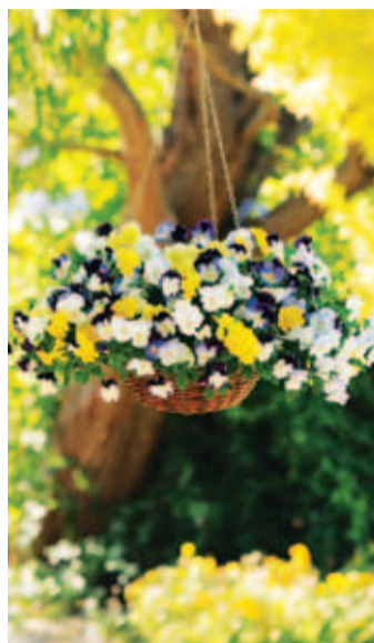
Ripp-võorasema Cool Wave.