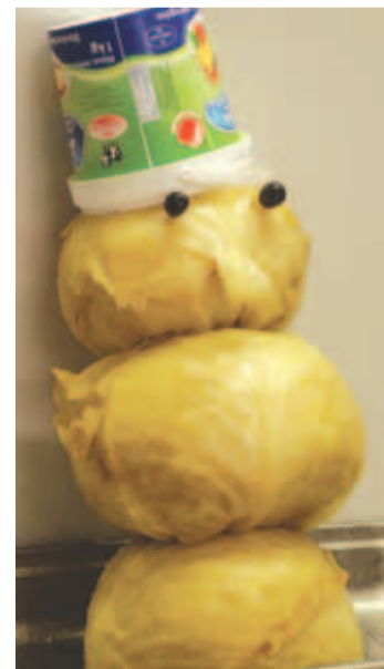
Töötajate valmistatud kapsamemm.