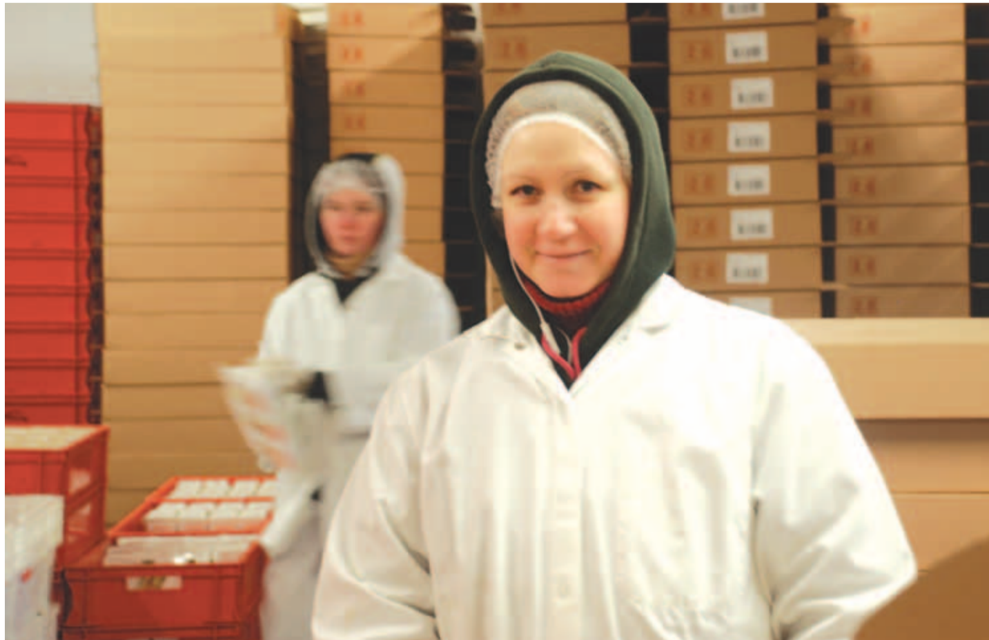
Hoolimata jahedatest tööruumidest on töötajad naerusuised.