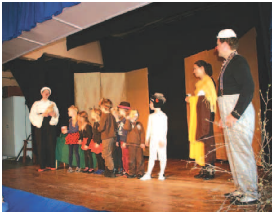
Jõelähtme valla lasteteatrite festivalil mängiti maha mitmeid etendusi ning taas oli positiivselt üllatajaid.