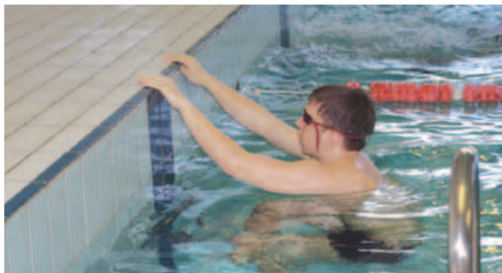
Valla meistrivõistlustel ujumises oli tihe konkurents.