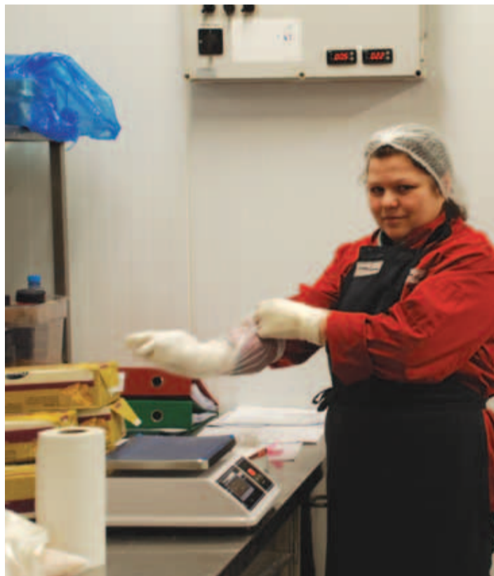
Ükski Lunden Food OÜ toode ei sisalda säilitusaineid.