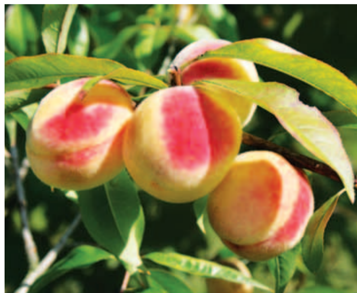
Harilik virsikupuu 'Sotšnõi'.