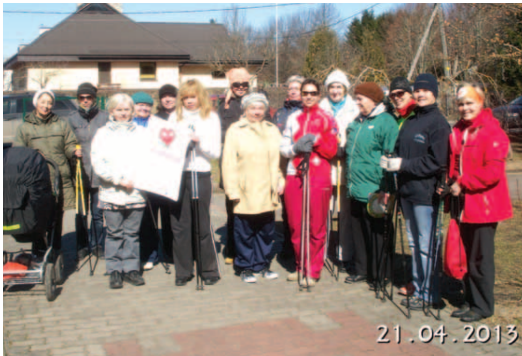
Neemekad tegid kõige pikema kõnniringi.