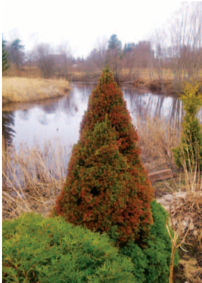
Istutate puu, kuid võral tekib põletus. See näitab, et puu on harjunud teistsuguse päikese intensiivsuseastmega. Vääna Puukool

Juuniks on selged suuremad talvekahjustused, mis seotud juurestikuga. Elupuudel võivad tekkida võrasse üksikud pruunid oksad. Kui te ei eemalda juunikuus võrast pruune oksa, ei kas-